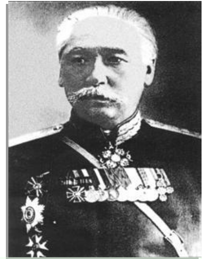
АРСЕНЬЕВ ДМИТРИЙ ГАВРИЛОВИЧ

13 2226 13 марта 95 8/15 В Канцелярию Приамурского Генерал-Губернатора. Ввиду того, что предметом от 24-го марта 1895 года, т.е. 1894 года, имеет место преобразование при сей Канце- лярии Генерал-Губернатора, в со- ответствие с тем, состоявшимся 21-го сего Марта, 1895 года, учреждением в Амурской области Областного Статистического Комитета. Военный Губернатор, Генерал-Майор Д.Г. Арсеньев Ввиду того, что предметом от 24-го марта 1895 года, т.е. 1894 года, имеет место преобразование при сей Канце- лярии Генерал-Губернатора, в со- ответствие с тем, состоявшимся 21-го сего Марта, 1895 года, учреждением в Амурской области Областного Статистического Комитета. Принят Канцелярией. В. М. М.